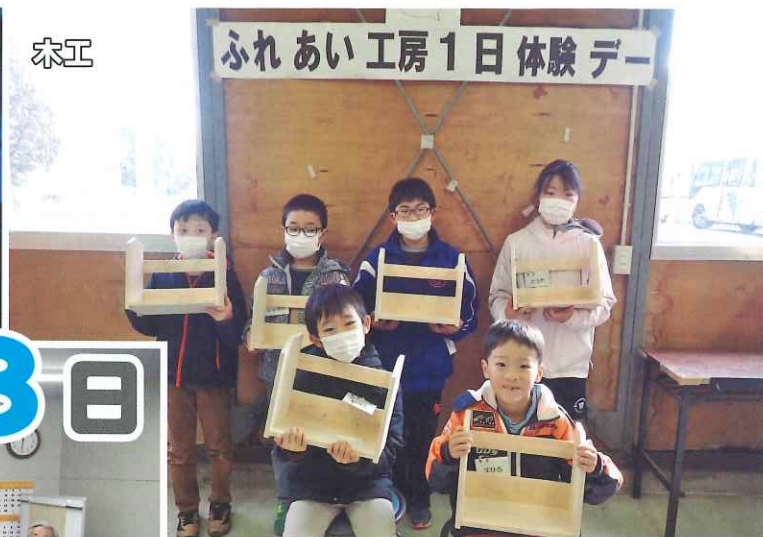
ふれあい工房1日体験デー