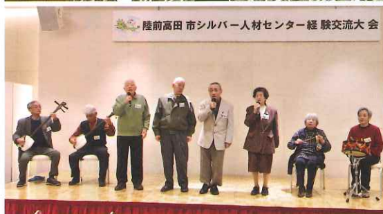
陸前高田市シルバー人材センター経験交流大会