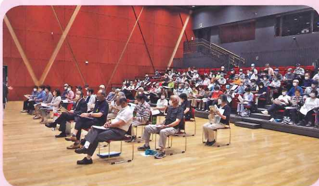
令和6年度安全・適正就業推進大会